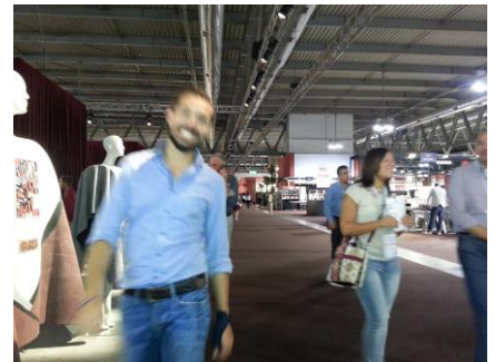
一つの会場から先が遠くて見えない