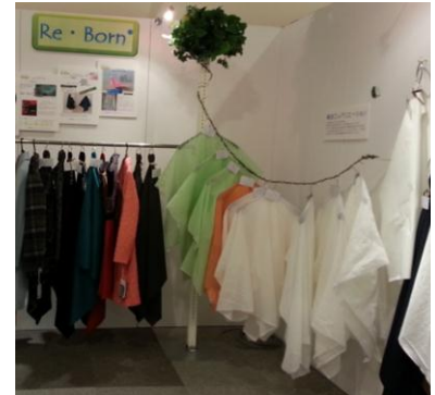
4 月 SS 展のインパナ後加工コーナー

先の MU ミラノウニカ出展で得たヨーロッパの情報・動向も交え、 今回は、MU トrendコーナーに選定された 5 商品をお見せしながら 日本市場に向けた新柄の Re・Born 弾・張・等の商品展開をします。