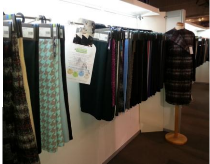
尾州・ウールブースのみづほ商品

《Re・Born 弾》が4点も選ばれた理由は、 Re・Born 弾の加工商品が MU 2 0 1 7AW のトレンドテーマに 象徴された仕上がりになった事と、ムース加工と加工方法により テキスタイルの新しい表情と表裏の違いが評価された様だ。