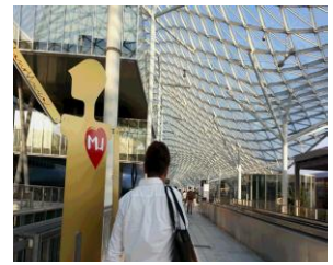
入場口からもまだまだ遠い

特に、次世代リーダーからエシカルファッションとかシェア市場の動きが加速していて見逃せません。